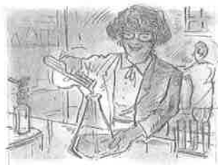
Mélanie: 7:45, 😊

6 Write a conversation between Mélanie and Alexandre in which they ask each other what time they have these classes and their opinions of them.